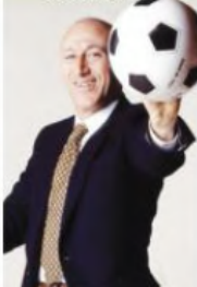
De Laurentiis aveva 81 anni

SECURITY 60® SISTEMA PERSIANA ORIENTABILE IN ACCIAIO