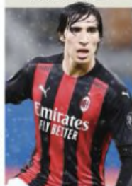
Sandro Tonali, 20 anni