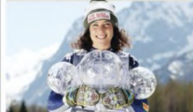
Federica Brignone, 30 anni, con i trofei vinti nella scorsa stagione